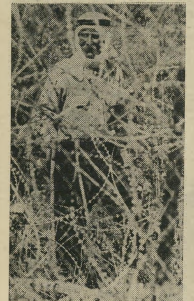
כתבנו בפעולה ליד גדר הדרום משגשת