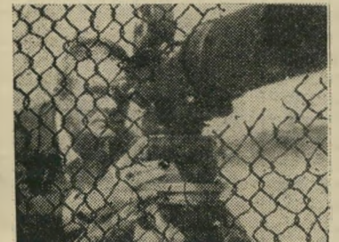
פלאח המזרחי לא מודאגים, המוראל גבוה

„אהלאן יורם, קראנו לעברו, „אהלאן אחמד, ענה יורם. „איך חוגגים אצלכם את חגי-הפורים?“, „התחפשנו לליצנים ולמלכות-אסתר, ענית לו בבדיחות-חדעה. „ואיך המוראל?“, שאל יורם. „מאה אחוז, אינשאללה, עניתו.