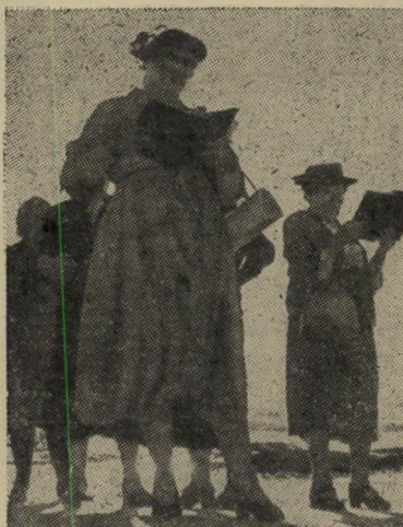
רוב הציבור בשעת תפיסה לרמטכ"ל עם חזה שער