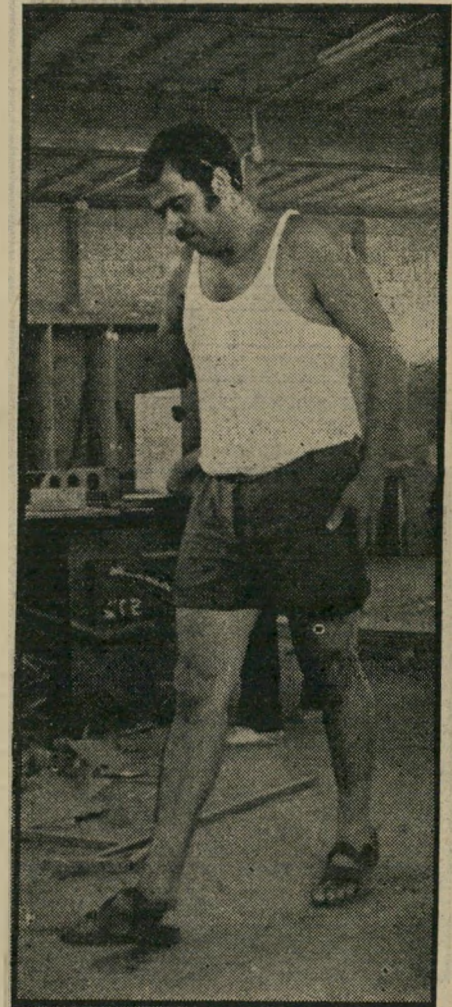
הנגד שעובד בשביל הבוס

למבקר קבלה על ששילם 1000 לירות מעל מחיר השוק.