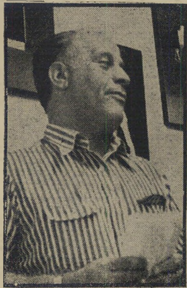
מוחזר טוינה גיס או לא גיס?

לדעתי, חובת העיתונאי הישר היא לבדוק העניין לאמיתו של דבר, ולהביא בפני הקוראים כתבה נכונה ובלתי-משוחדת. כמישפטן, לא אכנס לעובי העניין האם