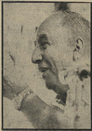
מוכ"ל משל להיות איפה, מחוץ?

מוכ"ל ההסתדרות יצא את הארץ לחו"ל דת קונפדרציית האיגודים המקצועיים היקפיים במכסיקו, קודם שבינת עובדי