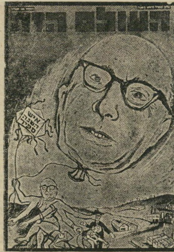
איש השנה תשכ"ז כלכלן ספיר