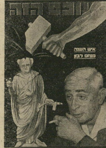
איש השנה תשכ"א מודח לבון