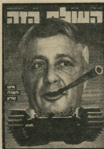
איש השנה תשל"ג מקים הליכוד שרון