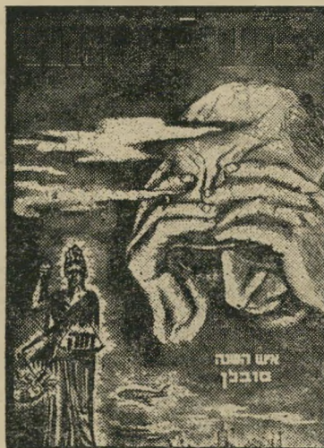
איש השנה תשכ"ב קורבו סובלן