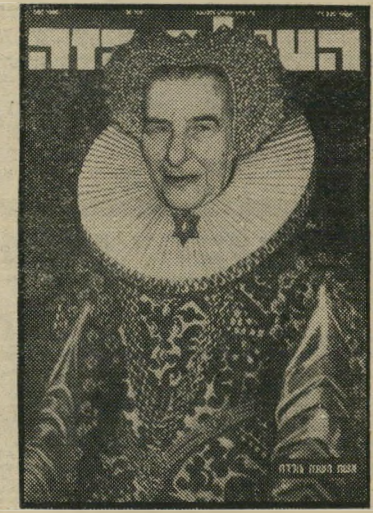
איש השנה תשל"ב גולדה המלכה