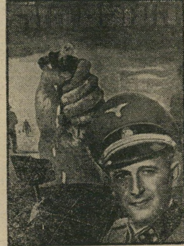
איש השנה תש"ך רכז שואה אייכמן