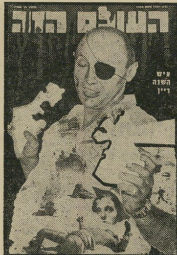
איש השנה תשכ"ז שר-הביטחון דיין