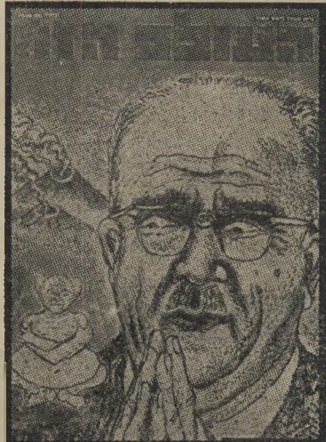
איש השנה תשכ"ד יודש אשכול