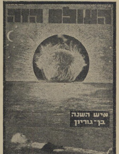
איש השנה תשכ"ג מתפטר בר-גוריון