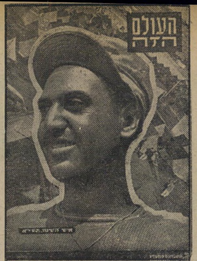
איש השנה תש"א העולה החדש