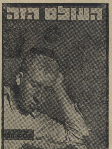
איש השנה תש"ח חתן תניך חכט