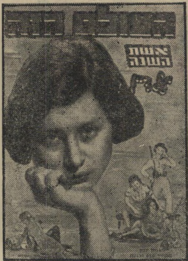
איש השנה תש"ט סופרת דיין

סיכומי השנה של "העולם הזה", שכבר הפכו מאורע עיתונאי שתהודתו מגיעה הרחק מגבולות המדינה, יורידו את המסך על מאורעות השנה. לא לפנים — להפסקה בינכד. כי באותה שעה ממש כח עוסק חלק מהמערכת בהכנת גיליון ראשיהשנה, נמצא חלקה האחר במירוץ לכיסוי המאורעות השוטפים — אלה שיולידו אולי את אישיהשנה של השנה הבאה.