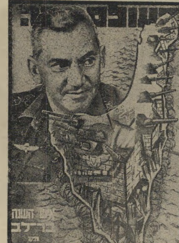
איש השנה תשכ"ט מפקד מיבצי-ישראל בר-לב