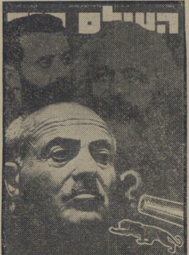
איש השנה תשל"א מזכיר ההסתדרות בר-אהרון