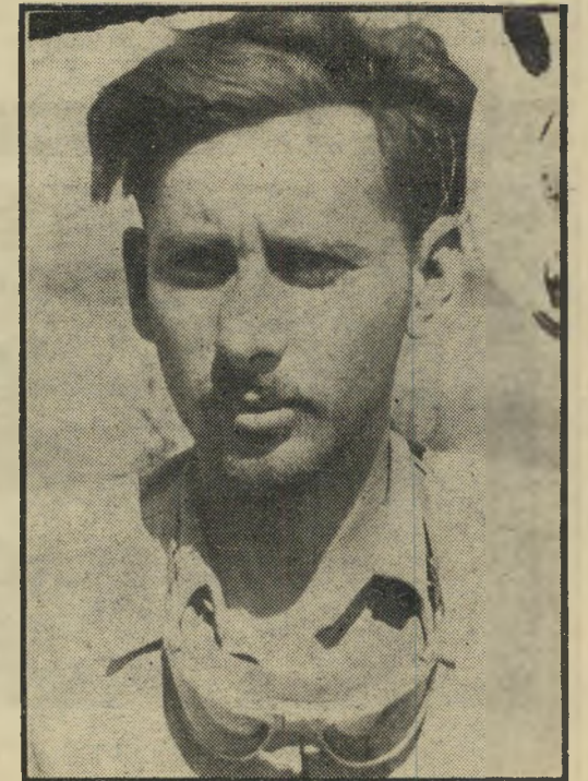
העיפות והאימה: אבנרי למחרת הקרב הגדול על עיבדים

המג"ד, הנהוג בגיפ הראשון, נוסע במהירות רבה. זהו תענוגו העיקרי בחיים. כקילומטר אחד לפני נגבה אני מרגיש לפתע שאנשי הגיפ הראשון מתכופפים קימעה. ג'סטטה שהיא אופיינית לחייל מנוסה החש בסכנה. מה קרה? אני צופה בשטח. אני רואה דבר. כן, אני רואה משהו. לפני בית עפא נעות בשדה חמש נקודות שחורות הגדלות והולכות מרגע