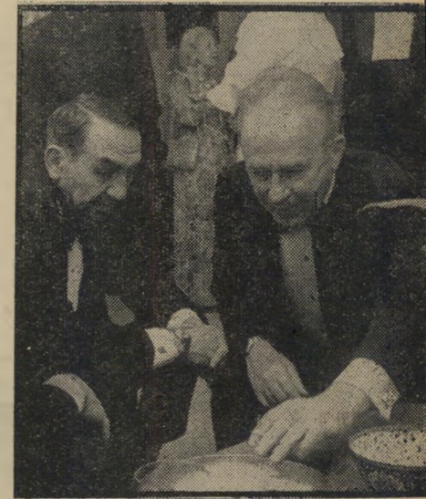
רבין בווישינגטון (עם סיסקו) מה מונח על השולחן?

בדרום, הוא מדבר על "הגבול הבינ-לאומי" שיש לשנותו. זהו קו רפח-אילת. במיוחד הוא מדבר על "הגבול הירדני". פירוש הדבר, פשוטו כמשמעו, כי רבין סבור שאין אף צורך להתדיין על רצועת-עזה. אין היא שייכת למצריים, ולא לירדן. מכיוון שאין גורם פלסטיני בתמונת-העולם