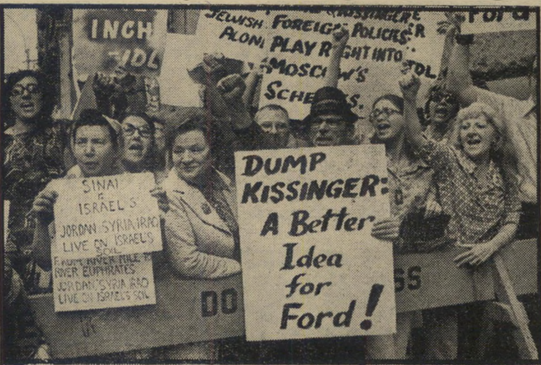
הפגנת הדינה להגנה יהודית בעת ביקור רבין — בתנאי ישראל תנצח

המיפלגתית המשוונת חפצים ראש-העיריה והמושל — כל קו תקיף, לאומי ומילחמתי נגד הערבים הוא בבחינת בשורה מהשמים. כמו כל יהודי-ציוני-פרטיות-פרטיות-ישראלי רוצה היהודי הניו-יורקי הממוסד במילחמה, בתנאי שהישראלים יצחו בה. הוא אינו רוצה להתזר את השטחים המותוקים לי-ערבים, אינו רוצה בהסכם עם הפלסטינים ואינו רוצה בשום מורה מדינית שממ-ילתי-ישראל אינה רוצה בה. לכן יש לישראלים ממשלה שכוו ולעיר ניו-יורק יוס-חג, כשראש-הממשלה האמיתי של מרבית תושביה מגיע העירה.