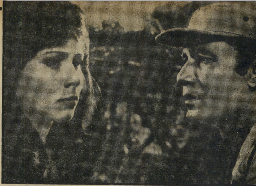
"הכדור עדיין בכיסי" לנקום את דם החברים