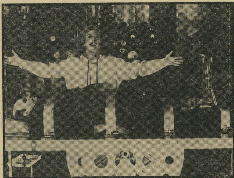
ויילדר בדמות פרנקנשטיין הצעיר והמיפזן דמו של סבא

המחשבה שמשוהו מדמו המטורף של הסבא, ואולי גם מכוח יצירתו הדמיוני, עבר אליו בירושה, דוחפת את הפרופסור הצעיר ללכת בעיקבות המקורות, אל אותה עיירה בטרנסילבניה שם, בארמון על צוק סלע, שאינו אלא עותק מדויק של הארמון מסירטיה-המיפלצות המקוריים, הוא מגלה את מעבדת סבו ואינו יכול להתאפק מל-לנסות אותה. אלא שבעזרת משרת גיבן (מרטי פלדמן) ובעל אופי אינדיבידואלי אליסטי מיוחס, שותל הפרופסור בראשו של היצור שחטף (פיטר בויל) מוח של לא נורמלי שהומצא לו על-ידי משרתו בטעות, תחת מוח של מדען גאון שאותו רצה הפרופסור להנחיל ליצור שלו, וכך חלים שיבושים קלים בתוכנית: המיפלצת איננה עוד יצור אימתני מפחד מאיך כמותו, כייאם מיפלצת אנושית. בוריס קרקוף והנשים. פיטר בויל