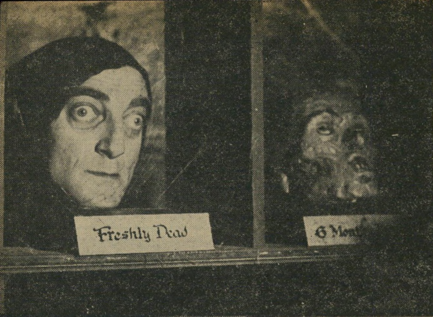
פזמון בדמות המשרת ב"פרנקנשטיין הצעיר" מוז לאנדומלי

חדשות שמאחה את החדשות ואת פרצופם הלא-מהימין-לפעמים של עיתונאים רודפי-שעוריות. ג'ק למון ויוולטר מתאו בפינגי פונג של מישפטים שנונים.