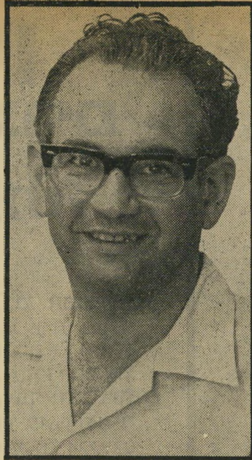
מפיק זמרן האשה שחפה

הסרט שצריך היה לצאת למסעכיבו- שים בחו"ל, ולייצג בה את עם ישראל, התגלה לאחר תום ההפקה כשואה ממש, וספק רב אם יתנו לו לצאת מגבולות המדינה.