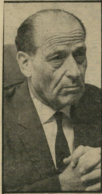
רימלט 39,494.40 ל"י