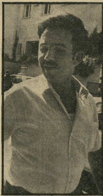
פלומין 8,462.30 ל"י

רואיהחשבון ח"כ יחזקאל פלומין (ליכוד / ליברלים) ניסעו יותר מכל חבר-כנסת אחר מהפחות. רוב הפחות האח-רון הוא שהה בגרמניה, במיסגרת המועצה לחילופי צעירים בין שתי מדינות אלה. הוא הספיק לשהות בארץ זו שמונה ימים, עד שהודיעו על הפחות. והוא נאלץ לשוב מייד, כדי לשרת את לקוחות מישרד