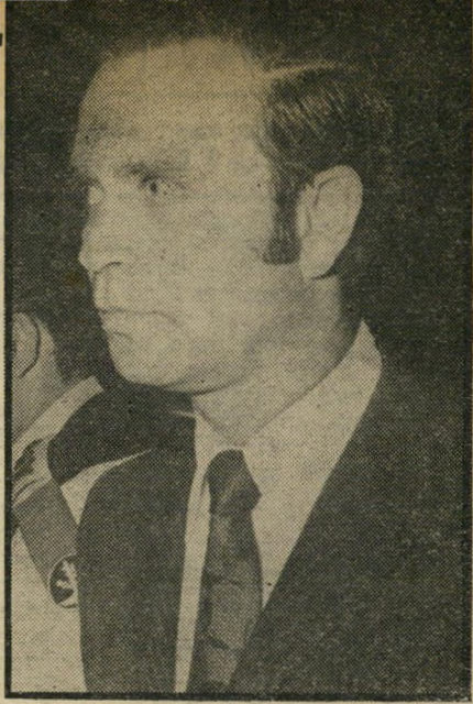
מת 31,876.80 ל"י

בתיק יחסיהחוזך בה. כמו שריהחוזך הג' דול, יגאל אלון, מרבה אף חריש בי נסיעות לחו"ל.