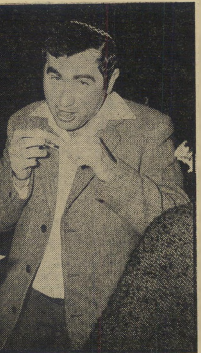
המבר 9,922.40 ל"י

ה ח"כ הצעיר, אחוד אולמרט (המרכז העצמאי), נסע על חשבון משרד-החוץ לפני כמה חודשים לארצות-הברית, שנמשך כחודש. מבלי לקחת בחשבון את הטיסות היקרות של אולמרט בתוך ארצות-הברית, ואת דמי האש"ל, הטיסה