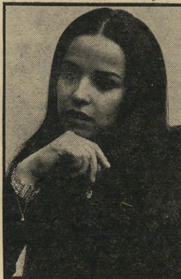
קריינית ושרי פרישה

נפסלו, וביניהם שייע, הידוע בחושה-ההומור המצויין שלו, אולם, כפי שהסתבר אחרי הצילום, ירא מהמצלמה. תוכניתו של בן-פורת תשודר אחת ל-