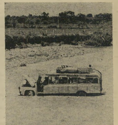
סע כמו יודך דחוף וראה את העולם

ולחליף אוטובוסים, עד שמיגיעים. ה- שירות אדיב. ניתן גם לשכור חסקה בשי- רתון. חמש לירות. באירופה קיימים שי- רותי תחבורה תקינים וזולים. בעלי ה- אמצעים יוכלו לפנות למשרדי „רנט א- עז” ולשכור עז חדישה או עדיספורט. 2 סנטים.