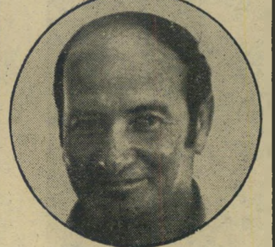
דובר שיפמן מה המחיר?

מי שמחפשים כל-כך בדבקות את הצדק ואת היושר, כדאי שגם הם עצמם יהיו קצת הגונים וישרים. כסיפורים שלכם על "התמונות" (העולם הזה 1965) לא חיפשתם באופן מיוחד לתאר את המיקרה בהקשרו הנכון וב- משמעותו האמיתית. וכתבתם דברים שלא היו מעולם במגמה ברורה להפוך דבר מכובר, יפה וחיובי למעשה עקום ושליילי. הסיפור הדוממתי של העולם הזה על אופן רכישת התמונות, המחיר המוגזם ש- ננקב בכתבה ובעיקר הכוונה הרעה לנייד עניין ישן שקשור במישרד-התחבורה לי-