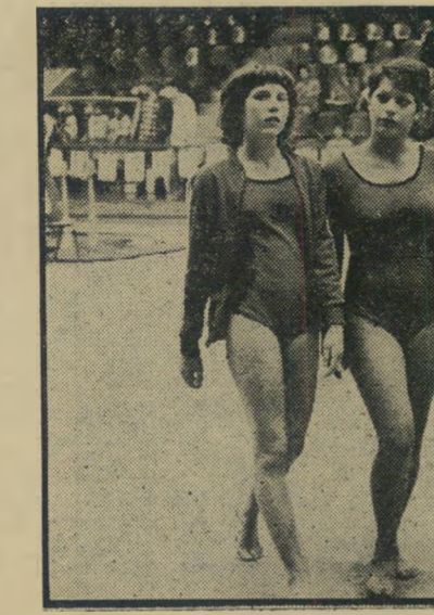
נערות ניבחרת ההתעמלות האמנותית של "הפועל" מידי מי

ברצוני להתייחס למסקנותי של אורי אבנרי (העולם הזה 1962), במאמר "ההתי- מוסטות". המסקנות נכונות מאד, אבל לא הובא שם האמצעי להשיג עצמאות כלכלית ואי-תלות במתנותיהם של אחרים. ארצנו מלאה ומשופעת באוצרות, המסוג- לים להפכו ממושטיידי לבנקרים של הי- עולם, אם רק נגישים את הטכנולוגיה החדי- שה לניצול אוצרותינו הדרומים. (המשך בעמוד 7)