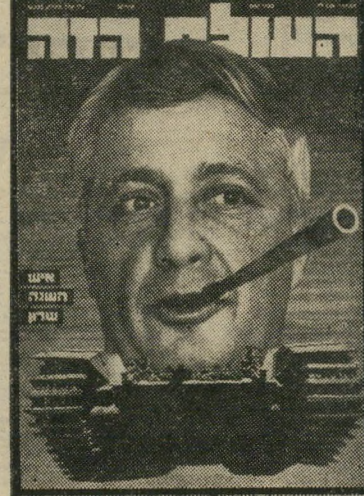
איש השנה תשל"ג מקים הליכוד שרון