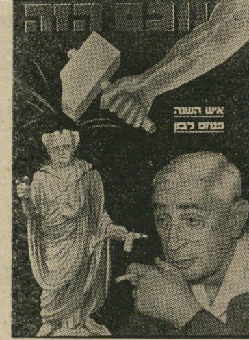
איש השנה תשכ"א מודח לבון