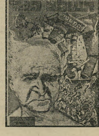
איש השנה תשכ"ה מפלג מפא"י בג'ורג'יון