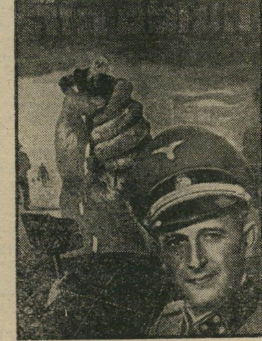
איש השנה תש"ך רכז שואה אייכמן