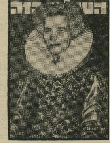
איש השנה תשל"ב גולדה המלכה