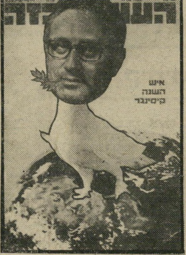
איש השנה תשל"ג מסדיר-ביניים קיסינג'ור