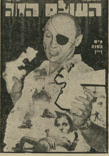
איש השנה תשכ"ז שר הביטחון דיין