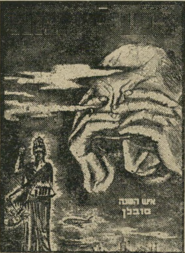
איש השנה תשכ"ב קורבו סובלן