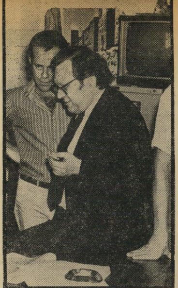
דובר אבנר הפעם זה הוא

אבנר, אינה שלו. אולי תתקנו את הטעות? רם נוי, ירושלים