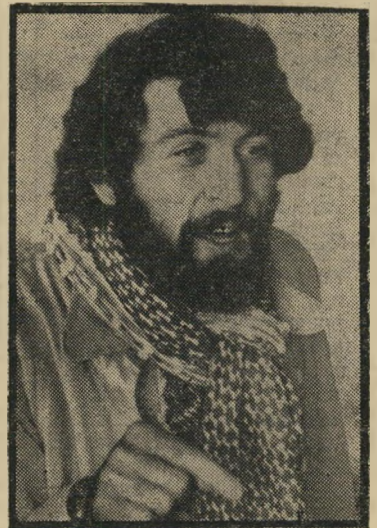
סטודנט מחוץ פעילות - אפס

דש חלק גדול מהזמן לשאלות שעוררו הסטודנטים הערביים בבעיות שונות, ובכלל זה פיסורי מורים בשל התערבות הש.ב. השאלות הקראו עליידי, ואף נתתי זכות שאלה בעל-פה למיספר סטודנטים ערביים באותו הקשר. לשאלות אלה (בשל האקטואליה) הצמדתי שתי שאלות שהופ- נו אלי בכתב עליידי סטודנטים יהודיים שנוכחו במקום, ששאלו האם יש מקום באוניברסיטה יהודית לסטודנטים ערביים הנהנים מסיבסוד לימודיהם עליידי ממי- שלת ישראל וממביעים תמיכה באש"ף. סוגייה זו, של הש.ב. ואש"ף, גולה