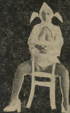
הקומדיה המשגעת את אירופה