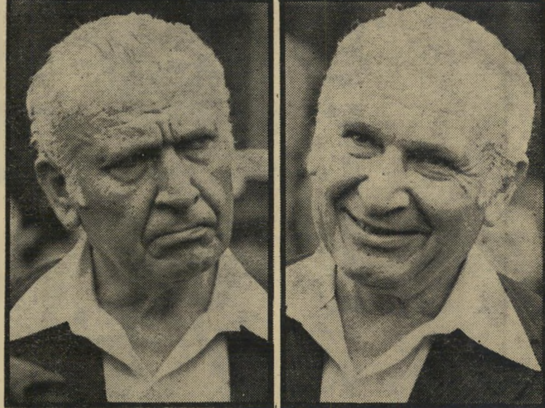
הנשיא בהלוויית מחרשק לפני ואחרי

עבודתו של צלם-מערכת היא, במידה מסויימת, עבודה כפויית-טובה. לעיתים, לצורך