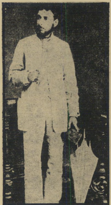
נפתלי הרץ אימבר שיכור כרוני