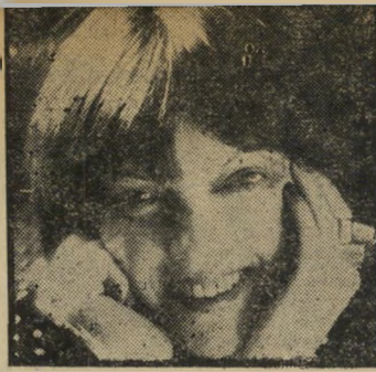
מרי קוואנט, האופנאית הבינלאומית המכתיבה מה נלבש וכיצד נתאפר.

אם את שייכת למאוסרות המעטות שניחונן בריסים ארוכים, את מעמ' עפת פעמיים בעיניך ומיד מתמלאות כל משאלותיך, כי הסובבים אותך לא יכולים לעמוד מול קסם עיניך המצועעות — הרי המדור הפעם לא יעניין אותך. אך אם את, כמו רוב בנות ישראל, ניתנת בריסים קצרים עד בינוניים, לעיתים דלילים ולעיתים עדינים מדי — קראי את המדור בעיון. אינך חייבת להסתפק במה שחנן אותך הטבע. גם את תוכלי לעפעף בעיניים מצועפות בעזרת ריסיים מלאכותיים.