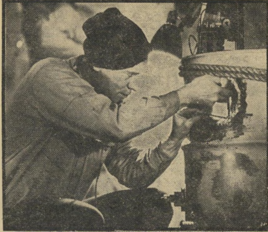
ריצ'ארד האריס - להתפוצץ בים

התוצאה: סרט-מתח צבעוני המכסה בתפאורות ו' שחקנים רבים את החורים בתסריט. ואם, בכל זאת, הוא