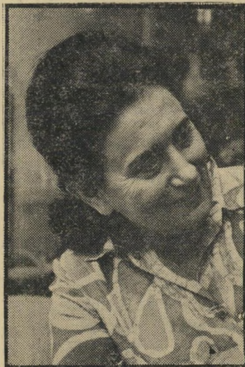
סופרת דיין פולקור לאמריקאים

עשרות אלפי הישראלים המתגוררים בניו יורק, והעשרות המצטרפים אליהם מדי שבוע יכולים להרגיש כאן כמו בבית.