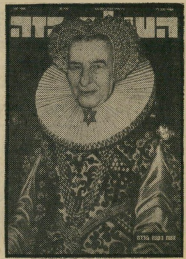
איש השנה תשל"ב גולדה המלכה