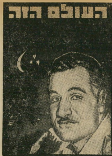
איש השנה תשמ"ז נשיא מצריים עבד אל-נאצר