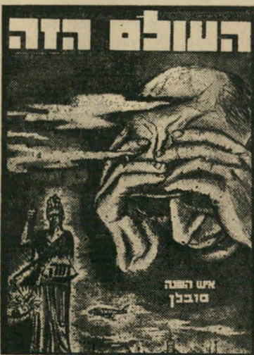
איש השנה תשכ"ב קורבו סובל