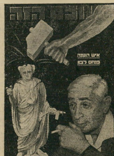
איש השנה תשכ"א מודח לבון