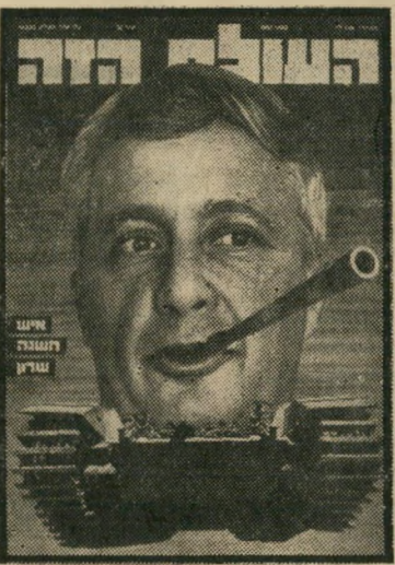
איש השנה תשל"ג מקים הליכוד שרון