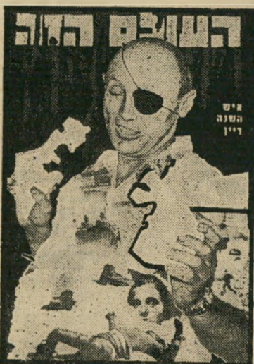
איש השנה תשכ"ז שר-הביטחון דין