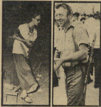
מתנחלים מזויינים כסבסטיה לקחת את הנשק!

...אני לא מתפלא על צה"ל ששיחרר את פנינה רוזנבלום מהמדים הלוחצים עליה. כנראה שמתכוונים להשתמש בה כבשק סודי נגד מדינות-ערב, ולכן לא רוצים שידעו על הקשר שלה לצה"ל. מיכאל זר, חדרה