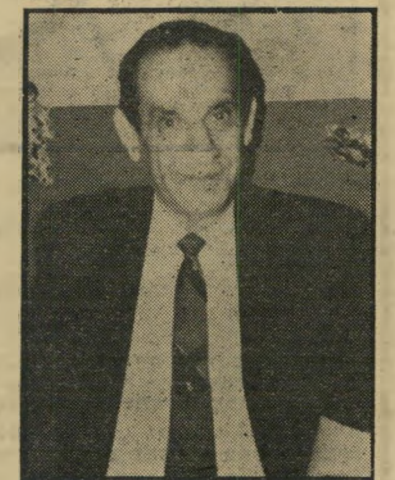
זו בוויאר — לכים הפריץ!

היא לא השקיעה דבר, כיוון ש„שיכון ופיתוח״ מימנה ל„מינמטל״ את כל ה־בנייה. עתה, באמצעות עסקה מסובכת ב־יותר, גרפו בוויאר־רוטברג שוב, מיליון