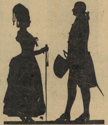
נוף באיטליה איטלקי ואיטלקיה מטיילים בשדות

איטליה היא ארץ שטופת שמש, ל- מעט ימים מעוננים. הצטייד בכובע. האיטלקים ידועים בטוב-ליבם ובשלי- טתם בשפה האיטלקית. להבדיל מארצות נאורות. יום השבתון