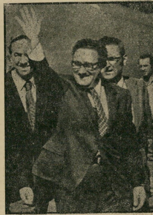
קיסיוג'ר וסיסקו: פחד מפני התערבות סובייטית

אין ספק שהסובייטים ידעו על ההכנות, וציידו את צבאות-ערב בנשק המירבי שהיה דרוש. אך נראה שהם לא הסכימו למועד הנקבע עליידי סאדאת ואסד. אחרת קשה להסביר את הבריתה המבהלת של היועצים הסובייטיים ערב המילחמה, שכללה לשמש אוהרה יחידה במינה לצה"ל על בוא ההתקפה הערבית.