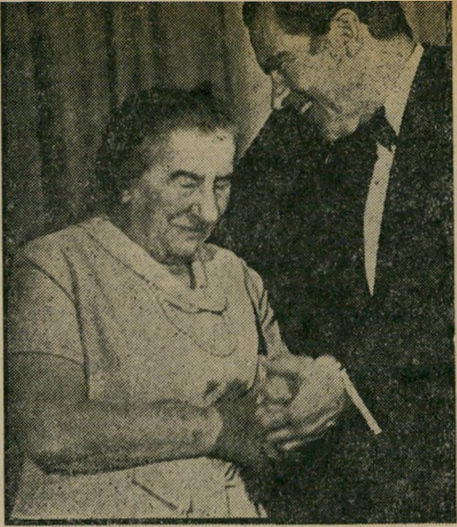
גולדה וניכסון: לחצים בעוצמה וגוברת