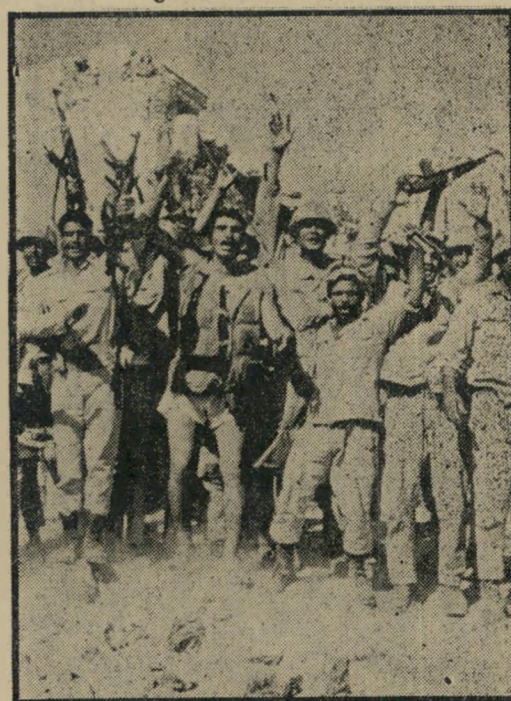
1973: חיילים מצריים מריעים בגדה המזרחית

אין ספק שהערבים לא חלמו ב־6 באוקטובר על ניצחון טוטאלי — כלומר, על השמדת צה"ל והכתבת תנאים