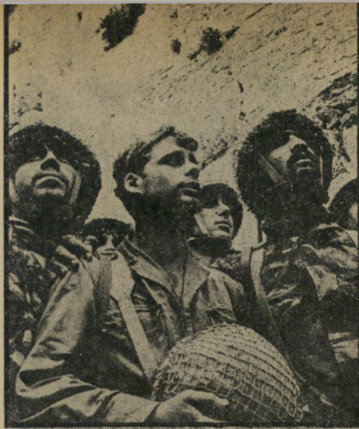
1967: צנחני צה"ל ליד הכוח המערבי

אין ספק כי התקפת הפתע של צבאות ערב הייתה כזו שהמנהיגים המדיניים והצבאיים של ישראל בהלם. אחרי שהגיעו הידיעות המרות הראשונות משדות הקרב והצטיירה תמונה ראשונה של התמוטטות מערכי ההגנה, היו כמה מהמנהיגים שנתקפו בדכאון עמוק וראו את המצב הצבאי מבעד משקפיים שחורות. היו מנהיגים מבוהלים, שלא העריכו נכונה את כוח הבליקמה של צה"ל. חששו