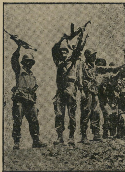
1973: חיילים סוריים מריעים ברמת-הגולן הכבושה