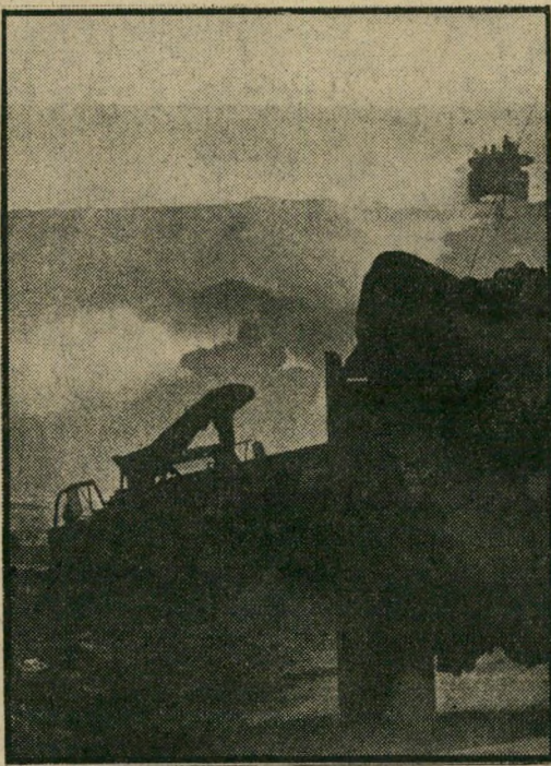
אחרי הפגזה ארטילרית: זלזול וחוסר תודעה