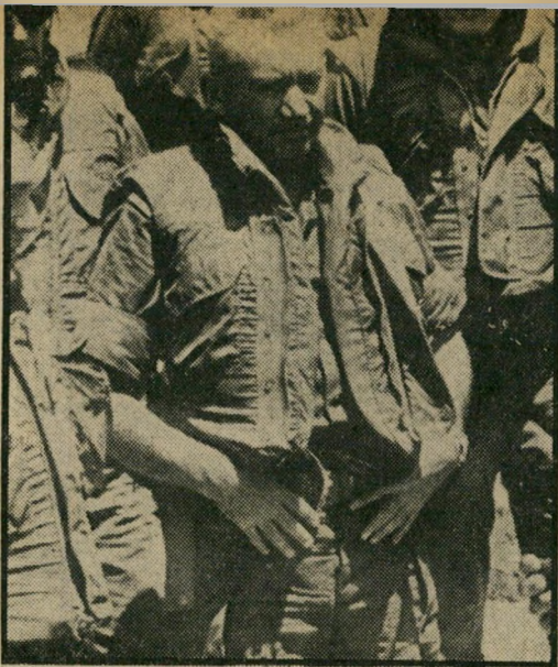
שיכבה פיצוץ: בר-לב באפודת מגן כמעוז בקו בר-לב