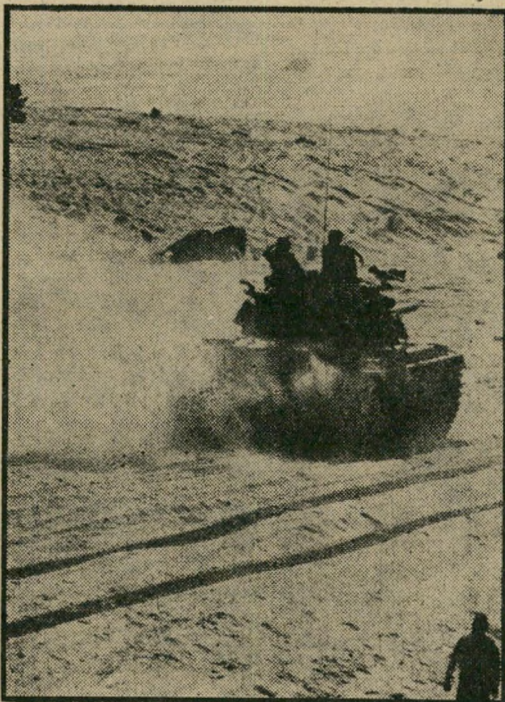
ההתארגנות: איפה היו מזובילי הטנקים?

אחת בסיס שהיה להתנגדותה של גולדה לפני ששנים למינויו של דיין: החשש פן הפעם יהיה זה אריק שרון שיקטוף את פירות הניצחון מבחינה פוליטית, דבר שיתבטא בבחירות העומדות להיערך.