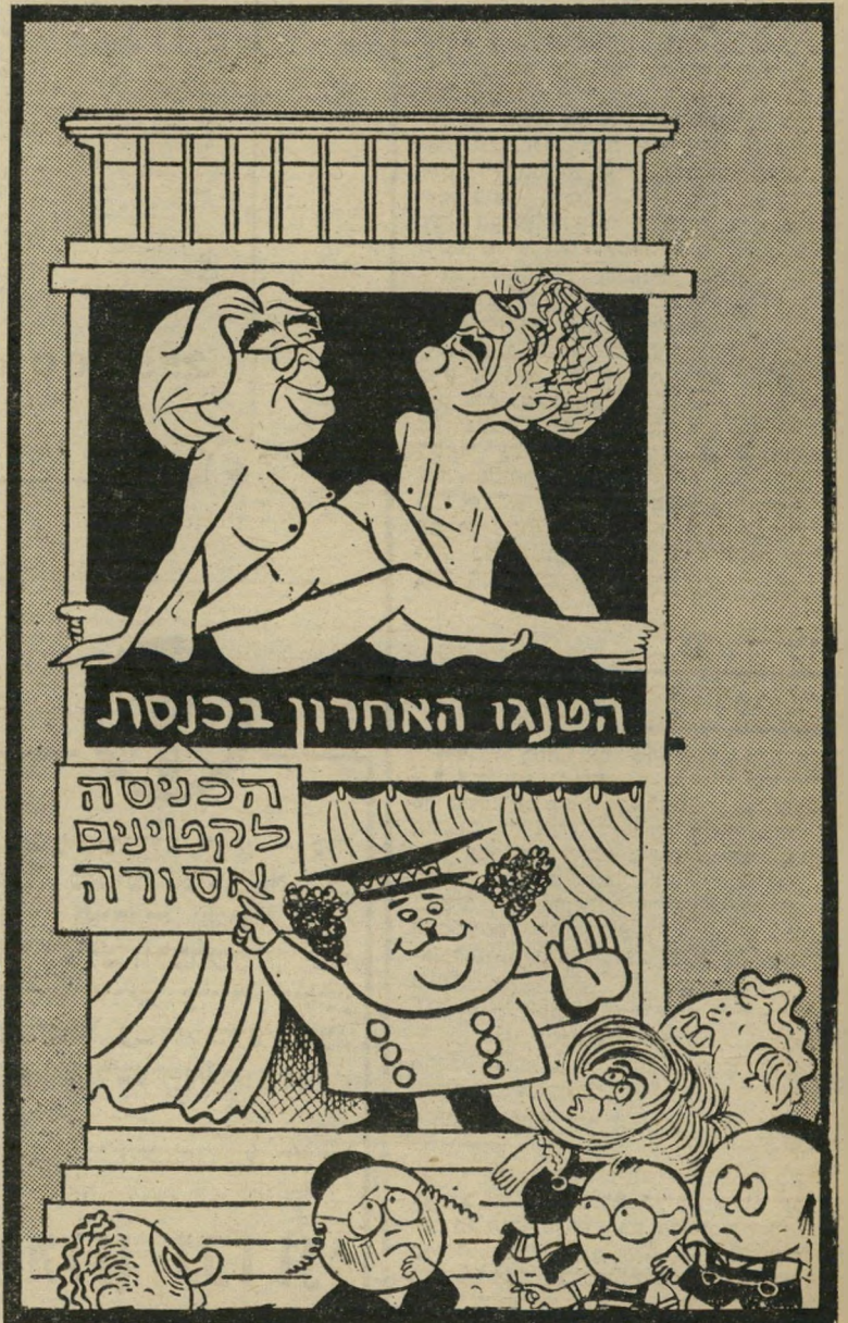
מתוך קאריקטורה של זאב ב,הארץ"

נקרא לציבור להחזיר לנו בקלפי את אשר הם גוזלים מאיתנו הלילה. ולא רק להחזיר את הגזילה — אלא גם