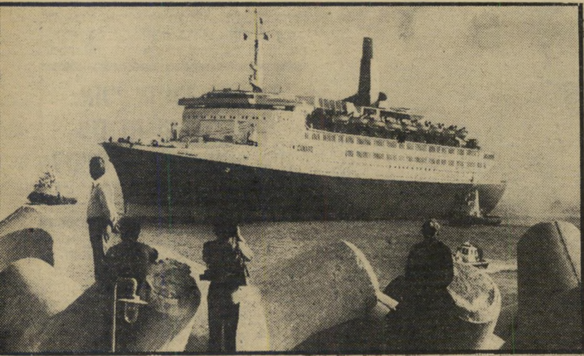
"קווין איזבט 2" עוגנת בנמל אשרוד — דמחה דקה

(המשך מעמוד 23) הארץ, 900 אנשי הצוות, לאחר שסיימו את תפקידיהם, החלו יורדים לחופשת-החוף. העיתונאים והצלמים ראינו את כל מי שתפסו. התרכזו בדון קיטר השחרחרת בת ה-21 ולין ג'ונס הבלונדית בת ה-20. שתיים מדיילות-הספינה היפהפיות. מי שהפר את השלווה היה שר-התחבורה. הכתב נעצר. השמחה החלה עם שחר. כאשר כתב הטלוויזיה מנשה רוז הצליח