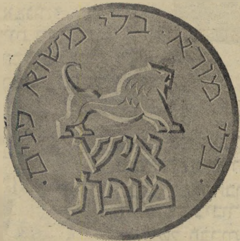
„אות המופת" של „העולם הזה"

בעת שחולקו השבוע, בטכס חגיגי שנערך בבנייני האומה בירושלים, עיטורי המופת, לגיבורי האומה מאז הקמתה, יכולנו אנחנו, במערכה זו, לברך על המוגמר בסיפוק. חלקנו לא היה אומ"ם עם הגיבורים מקבלי העיטורים, אבל אם זכו מאות לוחמים חיים, וכאלה שאינם עוד בין החיים, בתודת האומה שאינה מתבטאת רק באמירה, אלא באות שניתן לשאתו בגאווה — אז עם כל הענווה — יש גם להעולם הזה חלק בכך. אחד היסודות הרעיוניים של העולם הזה היתה ההפרדה המוחלטת בין המדיניות לבין מבצעה. אפשר לבקר בחריפות ובתקיפות מדיניות של ממשלה או מישטר, יחד עם זאת, אנו מאמינים, צריך להפריד בין קובעי המדיניות לבין מבצעה. אם אורח מדינה מחרף את נפשו ומסכן את חייו בביצוע פעולה, שאין לו כל שליטה על תהליכי קביעתה, אז ללא כל קשר לביקורת כלפי המבצע עצמו — מגיעה לאותו פרט תודת האומה. הנחה בסיסית זו היא שהיתה מונחת ביסודה של סידרת מאמרים שהתפרסמו מעל עמודי העולם הזה בשנים הראשונות שאחרי קום המדינה, תחת הכותרת תודת האומה,