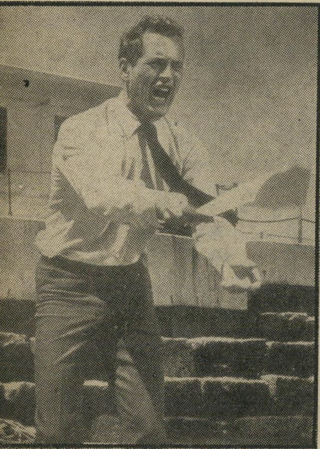
במאי ג'ומן התפעלות מהאשה

סביר בהחלט: ג'ון וודוורד החלה את הקאריירה שלה בפרס האוסקר שבו זכתה על הופעתה כנערה סכיופרנית בשלוש