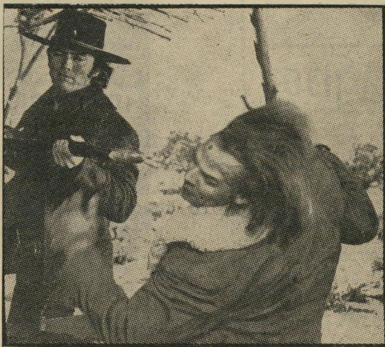
איסטווד וידיד: קל מדי

פטים צודקים - שאינם עולים בקנה אחד עם העובדות. התוצאה: החלק המתפלסף בסרט אינו משכנע יותר. אומנם יש כאן כמה רעיונות חביבים, כמו רכבת הנו-סעת ללא פסים בתוך בתים של עירה, או פגישת-בזק מיקרית של איסטווד עם אחד הנבלים במדרגות מלון.