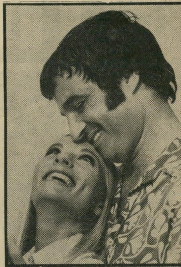
אילן ואילנית בקצב מזורז

„טעות היא לחשוב שאגדות העמים אהובות כלי-כך על הילדים משום שהן מתוקות ונחמדות ומרוחקות מן המצי-