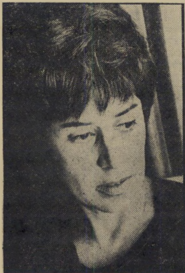
סופרת אבידר הכל — עד המיטה

לעצמה לכבד את גבר-חלומותיה בקפה וכריכים על שולחן פורמייקה רגיל בסלון — את תגיש לו אותם בתוך סל-נצרים שקנית בעיר העתיקה, לשלגוסך סוגה רומאית — שאין כמוה, אגב, להסרת עורפי שומן — ולראשך עבאיה אותה, ספרי לו קיבלת במתנה משייך בדווי ממרחב סיני. לא תאמיני, אבל הוא מסוגל להאמין אפילו לזה.