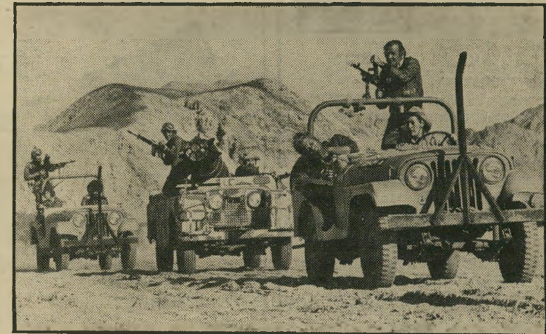
ותמונה מתוך סרטו "סברה קומנד" — כעסק משתלם