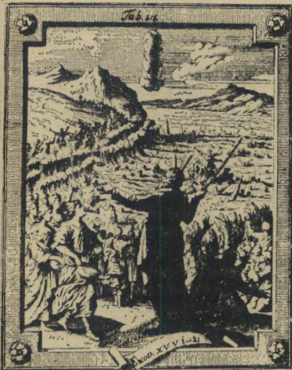
בניישראל חוצים את ים-סוף טקס מלכד

מכל הטכסים של הדת היהודית, טכס ליל-הסדר של חג הפסח הוא הטכס המאחד והמלכד ביותר. העובדה שהסמלים הכלולים בחג עצמו, ובסעודת ליל הסדר במיוחד, הם סמלים הומאניים כלל-אנושיים (כמו היציאה מעבדות לחרות, ותחילת עונת האביב) או סמלים לאומיים טהורים שהקשר שלהם לדת הוא מישני, הפכה את הפסח למאורע הנחוג גם ע"י אפיקורסיים, כופרים בעיקר, וחילוניים מובהקים. לפי אחת המסורות הרבניות, הקדימה מסורת ליל-הסדר אפילו את חג הפסח עצמו. אבי האומה, אברהם, הזמין את שלושת המלאכים שבאו לבקר, הרבה הרבה דורות לפני יציאת מצרים, שהטביעה על החג סמלים לאומיים וסמלים שוביניסטיים. כמו "שפוך המתך על הגויים..." אלא שבמרוצת השנים הסתלפו המשמעויות המקוריות של החג, הסימליות והלאומיות גם יחד. מאז הקמת המדינה מודגש ההיבט המחיה איבה בת 3000 שנה כלפי השכנה הגדולה מדרום — מצריים, ומציג אותה כאויבת מושבעת של ישראל משחר ימי האנושות.