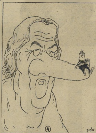
כוחו של אימון יפה לכל דבר (אליסטייר מקליין)