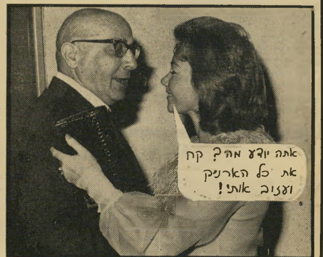
אתה יודע מה? קח את כל הארנק וצגוב אותי!

מתוך הפנקס האדום של ההסתדרות - לוח לוועדי העובדים