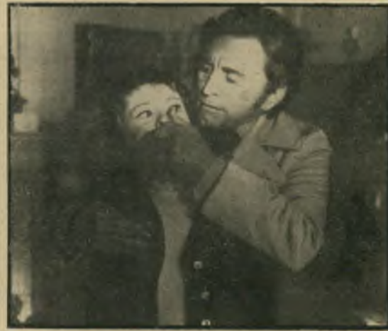
דאגלס ז'ובר: הטבור שבסנטר

פרטים נוספים אין טעם לגלות, אבל צריך לציין את חוש הקצב הנאה שבסרט, את החומר הבריטי שבא לידי ביטוי בהזדמנויות רבות, ואת האהבה הבולטת שיש ל' קלמנט ולחבריו לעצם אומנות הקולנוע.