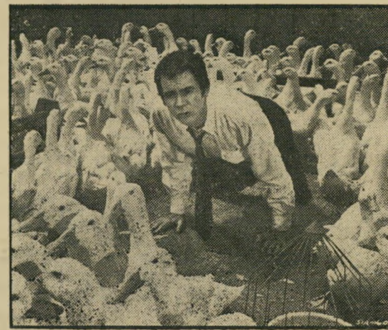
ג'ונס: בוא, ברווז רדיו-אקטיבי!

רק לקראת הסוף, כאשר מגיע הסרט, אחרי הרבה חוכמות פושרות לרדיפה המסורתית שחייבת לסיים כל קומדיה אמריקאית — הוא מתערער קצת לחיים. עד ל' סצינת-השיא, שמהווה דוגמא לא רעה של התעללות בנוער, במסווה של קומדיה בידורית. כל מיני דמויות-מישנה מוכרות מסרטים אחרים, כמו