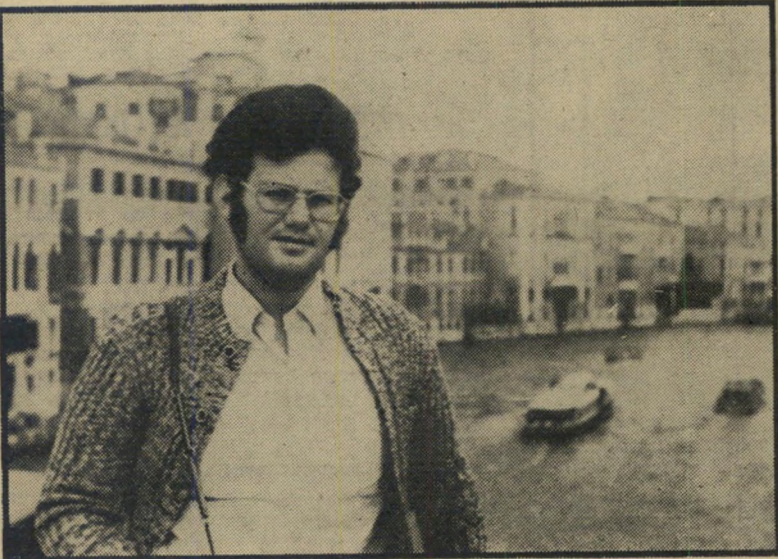
צייר גילדור (בוונציה)

יעקוב ואשתו עזבו את החדר בתי-פזון, לבושים בפיתומות. אך הבדיקה היסור