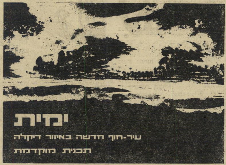
ימית עיר-חוף חדשה באיזור דיקלה תכנית מוקדמת

מעטפת התוכנית של משרד-הביטחון בה נמצאות התוכניות המפורטות להקמת ימית - עיר-החוף המתוכננת לקום בצפון-סיני, בין רפיח לשייך זוויד. הפצת החוברת הופסקה מייד אחרי הכשתה של גולדה. מסבירים מתכנני ימית את הצורך ואת הסיבות להקמתה לפי תיכנונם: "העיר המתוכננת מאותרת לחוף-הים, על גבול רצועת-עזה וסיני, והינה המשך רצוף של רצועת-החוף המיושבת בצפי-פות. כמוקד פיתוח יהודי היא מאריכה את שרשרת ערי החוף הישראלית בכי-60