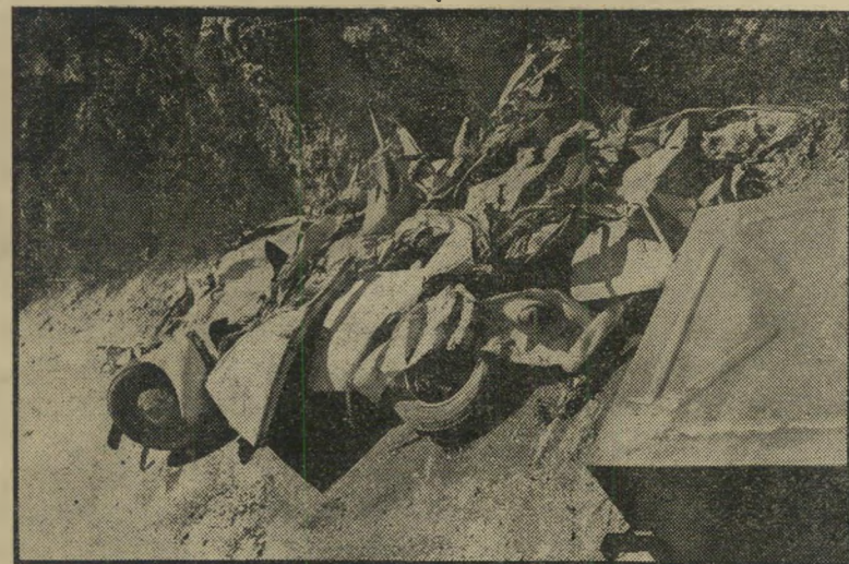
תצלום ישראלי: „פוקסוואגן“ מעוך — הטנק הדרום

טרילית של הפשיטה המשוריינת הישראלי. מול תעמולת זועה זו נשארה ההסברה הישראלית בחו"ל ללא מענה: שום תגובה, שום הכחשה, שום הפרכה. אחרי תבוסת שירותי הביטחון בחו"ל, נראה היה כי מכת המחדלים פגעה גם בשירותי הסברה הישראליים שם.