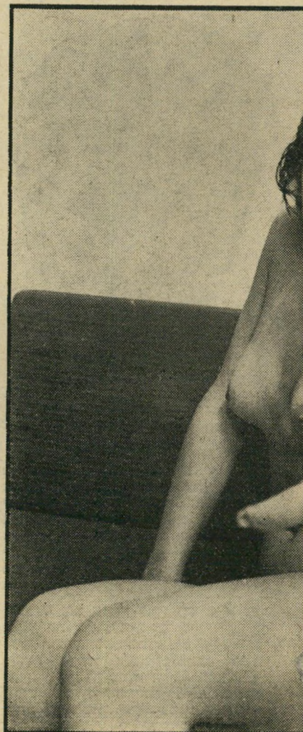
הנא הזה אמני!"

„הגברים הישראליים האלה! רבע שעה, והוכי, הביחה לאשה?"