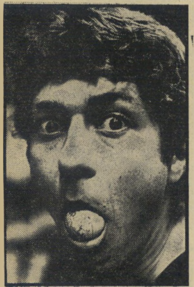
מפיץ שלום אויניס העולם כולו בפניו

הכל למען השלום. אויניס החל עור-שה מייד שימוש בכדורי-הארץ שלו: מחלק אותם על ימין ועל שמאל, תוך בקשה שיתקבלו כסמל למאבק למען השלום. מכל מקבל כדור, מבקש הצעיר (26) הקנדי לור כור שקל מאוד, בימים אלה, לפוצץ את כדור-הארץ לרסיסים, ועל כל אחד לעשות מאמץ, בדרך הנראית לו, לתרום למען בינתיים, בין חלוקת עולם למישנהו.