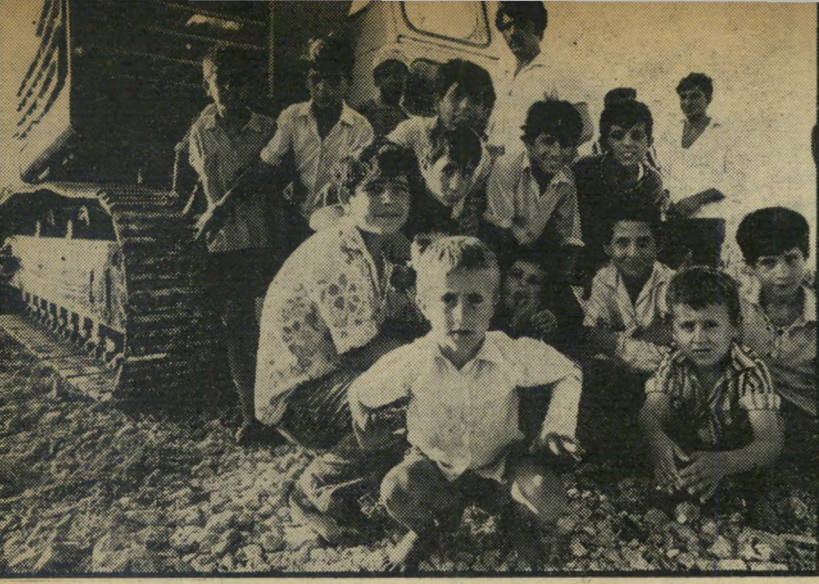
ילדי ברטעה שוכתים לפני הרחפור — קצינים בכירים בעד

ב ידיעה בכמה עיתונים נאמר שאחד מתושבי בירעם הודיע שתושבי הכפר מתנגדים לפעילותם של אורי אבנרי וחבריו, או לפעילותם של אנשי