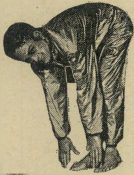
"כל שני תעמר וזהר מ"טרומבונים"

מדור זה הוא תוספת למדון המפורסם של דן בן-אנוש ונתיבה בן-יהודה. הקוראים מוזמנים לשלוח למערכת מלים וביטויים משלהם.