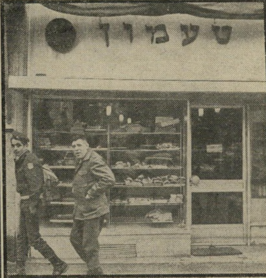
קפה טעמון מכה על הראש