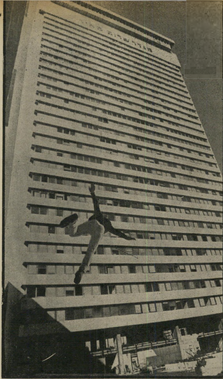
"...ניסיתי כמה פעמים, עד שעמד לי כוחי לקפוץ..."

הדודה דיברו רק אידיש ופולנית. לא שיחקתי עם הילדים. הם צחקו ממני בגלל הבגדים שלי ושאני לא יודע עברית. בכלל גם אני לא רציתי לשחק איתם. הם היו מלוכלכים. הייתי כל הזמן לבד. טיילתי לבד, שיחקתי לבד. הכל לבד. לא היה לי עם מי לדבר.